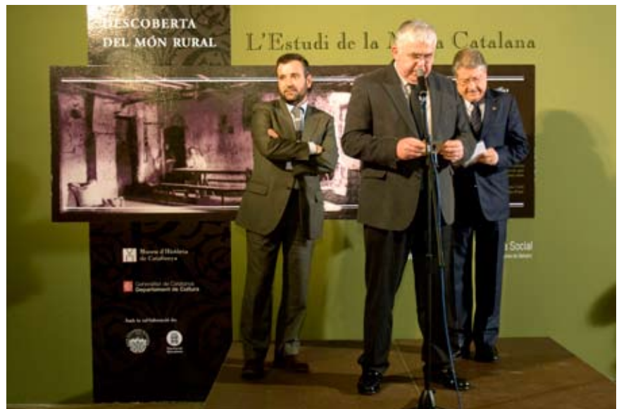
■ Inauguració de l'exposició al Museu d'Història de Catalunya, amb el Director General de Patrimoni, el Director del Museu i el Director de l'Obra Social d'Unnim.

Les premisses per desenvolupar el guió van ser pensar en una exposició itinerant, per a sales de format mitjà, amb capacitat d'adaptació i personalització als museus que hi estiguessin interessats. Per això, i també per limitacions pressupostàries, es va decidir que no s'hi exhibiria material original. (5) El principal mecanisme d'adaptació va consistir a fer un audiovisual amb les imatges dels entorns de la ciutat o co-