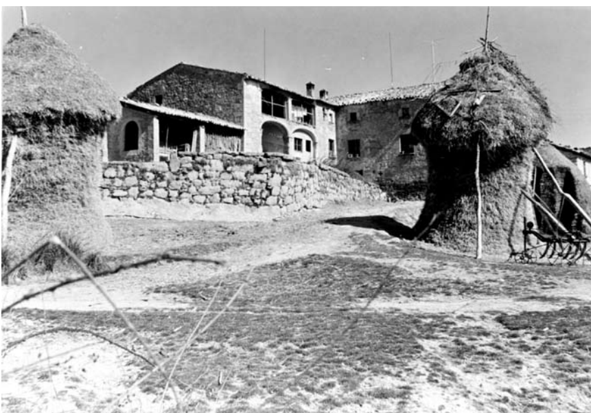
■ De dalt a baix: La Serradora (Castellterçol), Grup de Batedors a La Grossa (Mojà) i Can Vilaró (Lluçà).