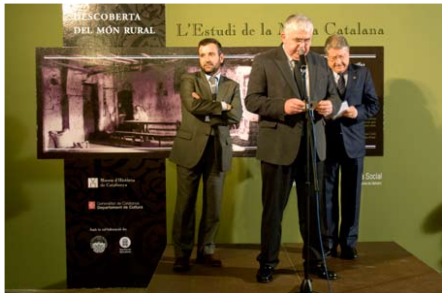
■ Inauguració de l'exposició al Museu d'Història de Catalunya, amb el Director General de Patrimoni, el Director del Museu i el Director de l'Obra Social d'Unnim.

Les premisses per desenvolupar el guió van ser pensar en una exposició itinerant, per a sales de format mitjà, amb capacitat d'adaptació i personalització als museus que hi estiguessin interessats. Per això, i també per limitacions pressupostàries, es va decidir que no s'hi exhibiria material original. (5) El principal mecanisme d'adaptació va consistir a fer un audiovisual amb les imatges dels entorns de la ciutat o co-